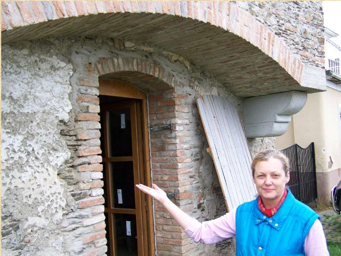
Freska na priečelí domu