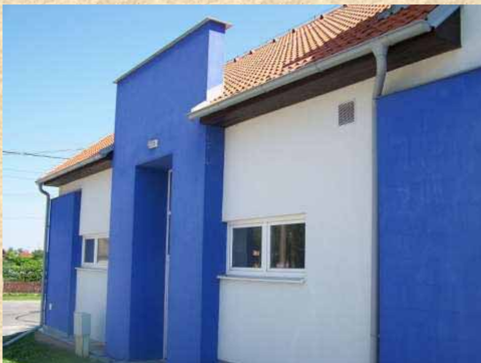
Husí ráj na Záhorí