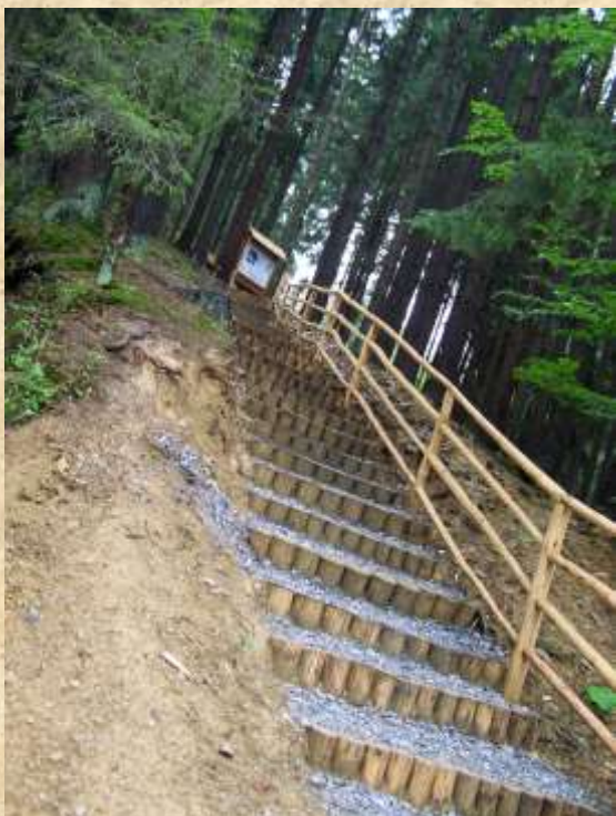
Kysucký dětský les