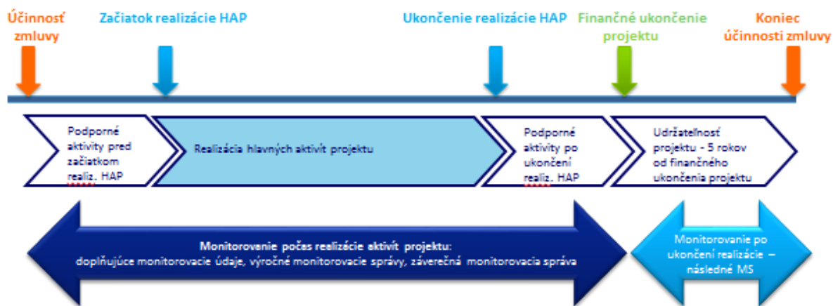
Obrázok 1 Monitorovanie na úrovni projektu