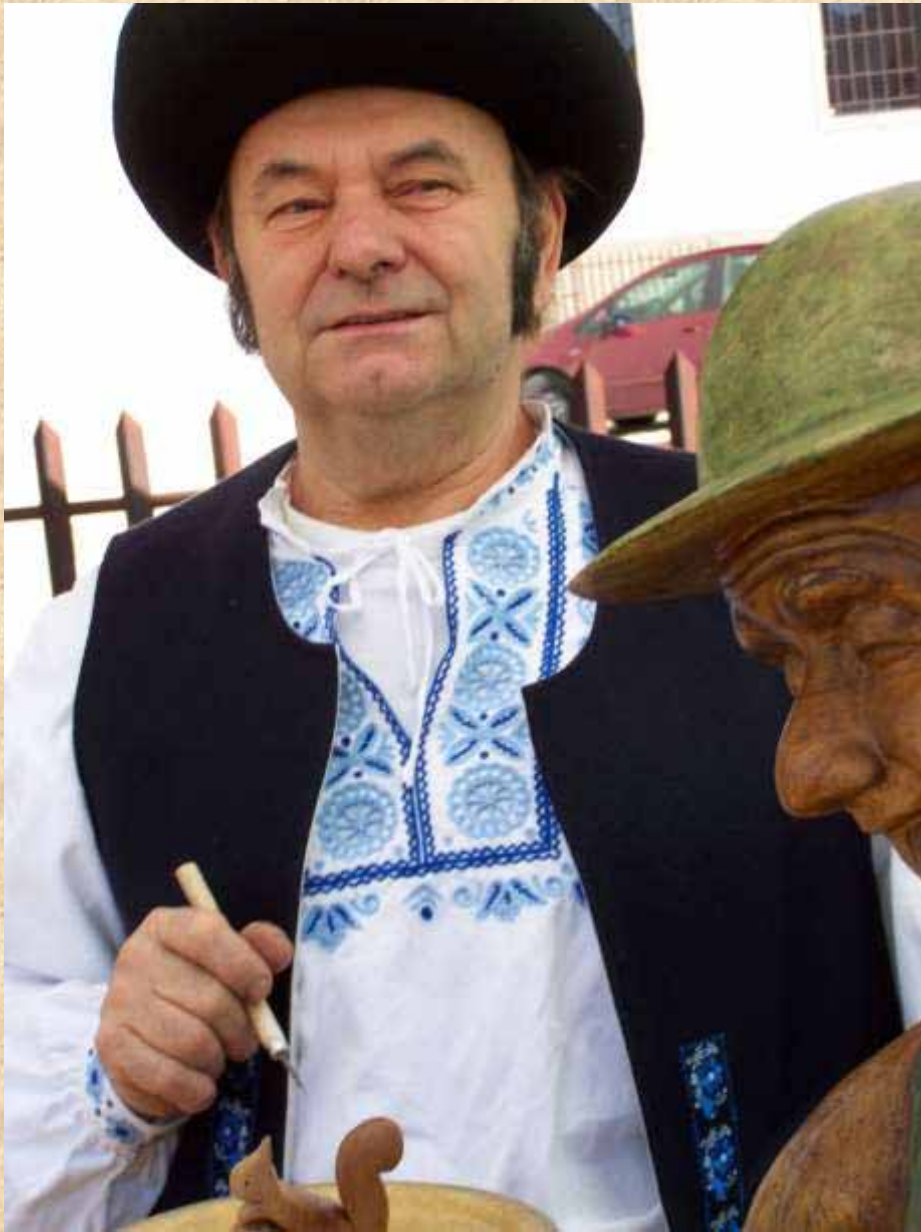
Stáročná rezbárska tradícia