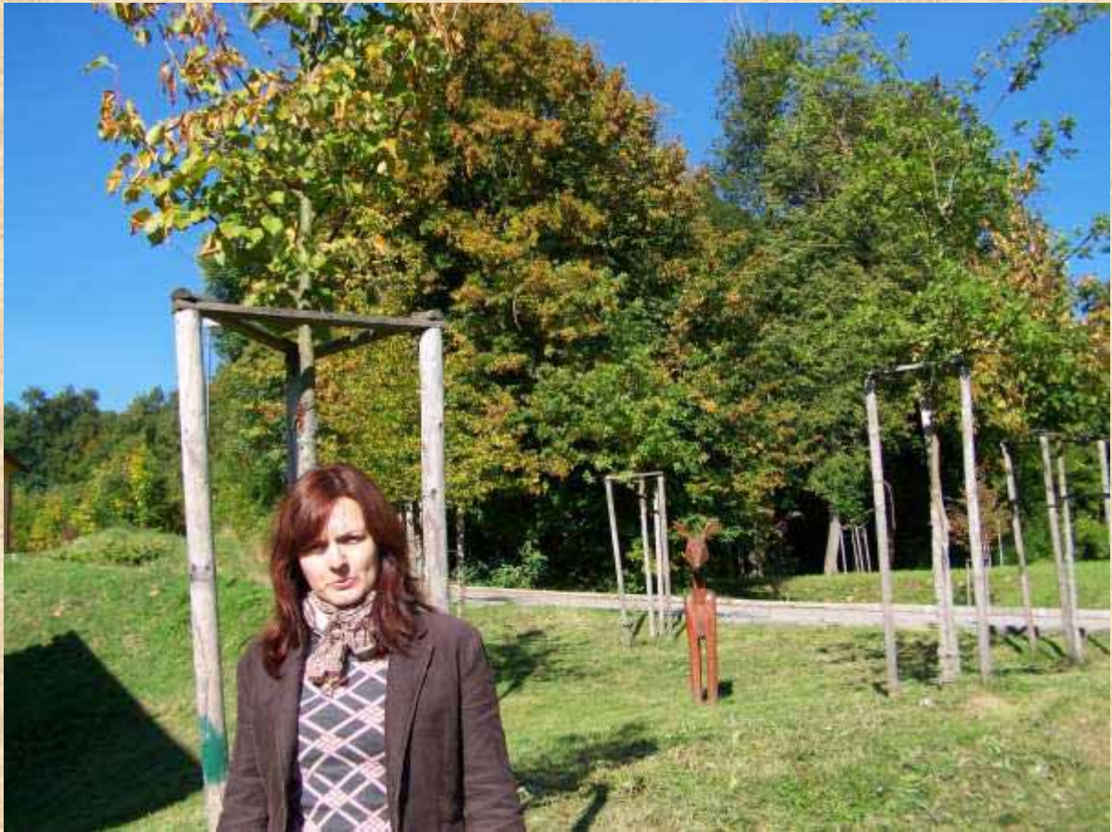
Arborétum blízko lavíc