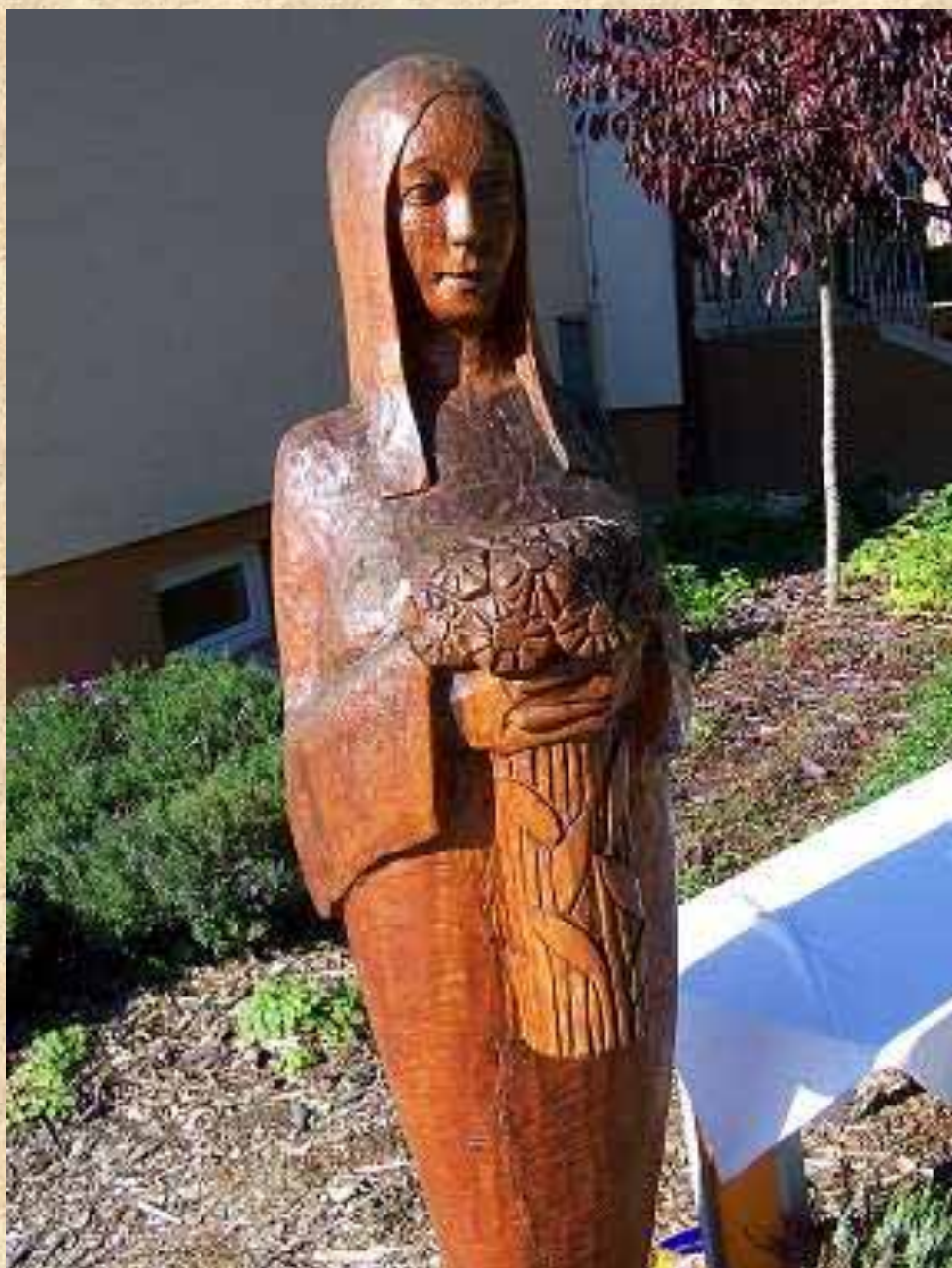
Poznanie stráži lesná víla